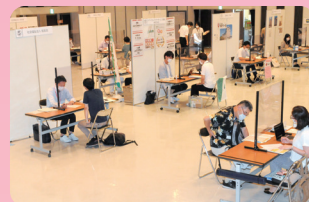
令和4年度同フェア面談風景