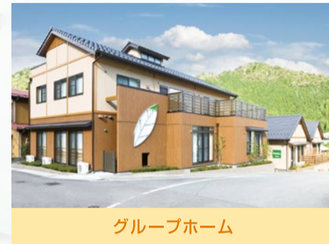
グループホーム うららびより 金山