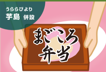
高齢者向け配食サービス お気軽にお問い合わせください TEL 058-240-4333 1食からでもお届けします