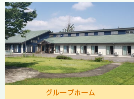
グループホーム うららびより なるがの 憩いの家