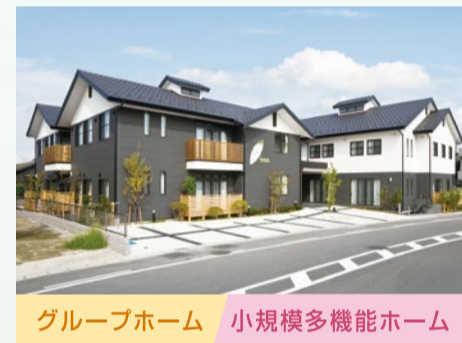
グループホーム 小規模多機能ホーム うららびより 奥町