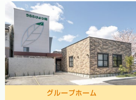
グループホーム うららびより 関