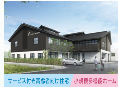
サービス付き高齢者向け住宅 小規模多機能ホーム うららびより 芋島 ■ うらら整骨院 芋島本院 併設 ■ 高齢者向け配食サービス まごころ弁当