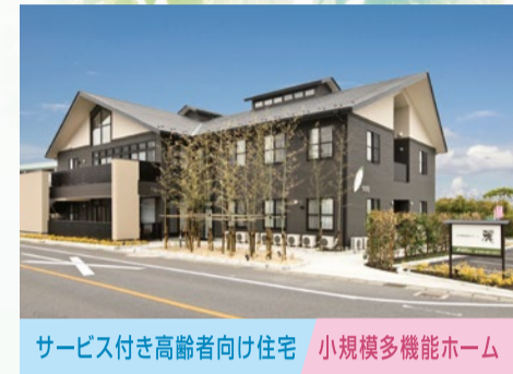
サービス付き高齢者向け住宅 小規模多機能ホーム うららびより 柳津