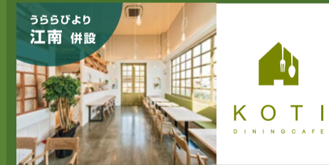
KOTI - DINING CAFE - カジュアルイタリアンをベースとした料理を提供 TEL (0587) 51-1222 〒483-8048 愛知県江南市江森町中24-1