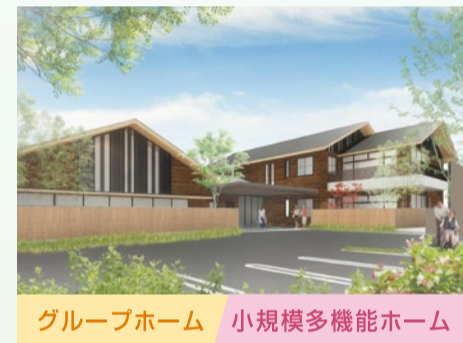
グループホーム 小規模多機能ホーム うららびより 江南 ■ 高間堂うらら整骨院 ■ KOTI - DINING CAFE - ■ 高級生食パン 今日もひとり占め 併設