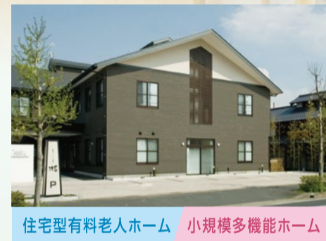
住宅型有料老人ホーム 小規模多機能ホーム うららびより 羽島 ■ 中央整骨院 ■ 和カフェかぐら 併設