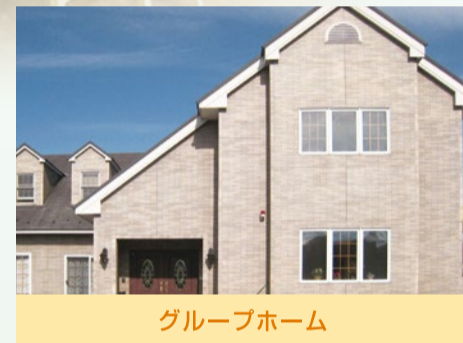
グループホーム うららびより 関ヶ原